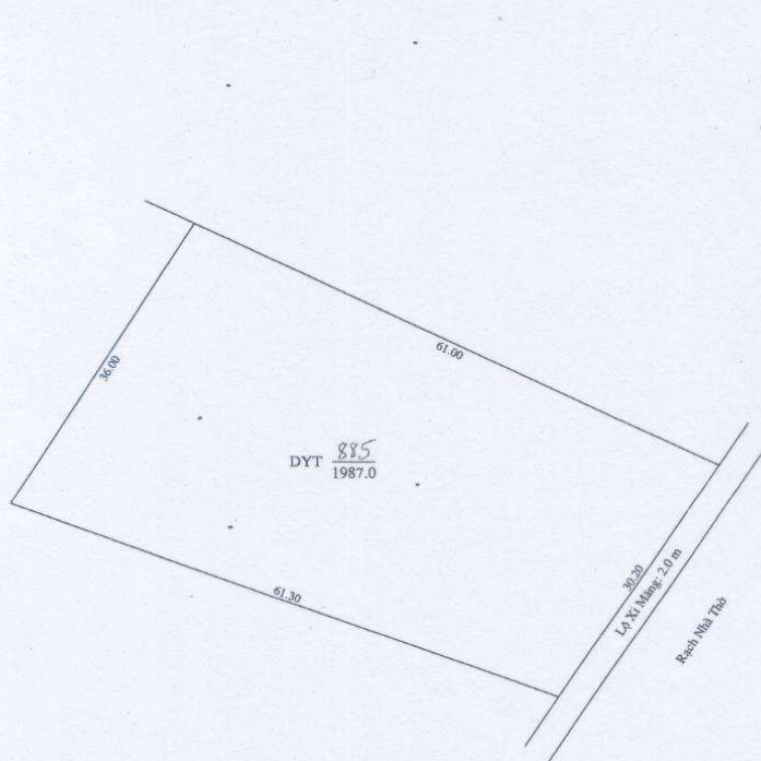
SƠ ĐỒ VỊ TRÍ